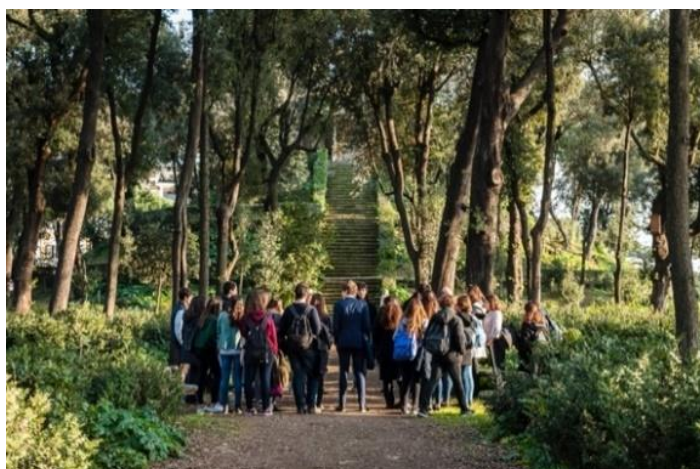
Villa Médicis

Lancé en septembre 2021 dans 15 lycées de Nouvelle-Aquitaine , le programme pédagogique Résidence Pro de la Villa Médicis invite 300 jeunes issus d'établissements professionnels, techniques et agricoles à travailler sur un projet en lien avec la ville de Rome et autour des métiers du bois, filière d'excellence du territoire néo-aquitain. Du Colisée à la Domus aurea en passant par l'Appia Antica, chaque classe étudie, s'empare et s'inspire d'un ouvrage patrimonial majeur de la ville de Rome pour inventer son propre "chef-d'œuvre" qui se déploie sous la forme de maquettes, mobiliers, constructions et autres créations originales, et nous invite à renouveler notre regard sur tout un patrimoine en partage.